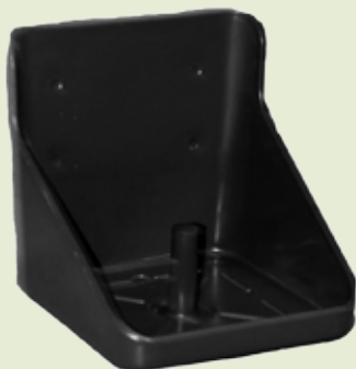
LIKSTEENHOUDER 10 KG