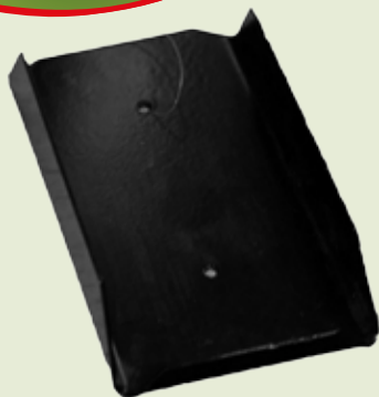
LIKSTEENHOUDER 2 KG